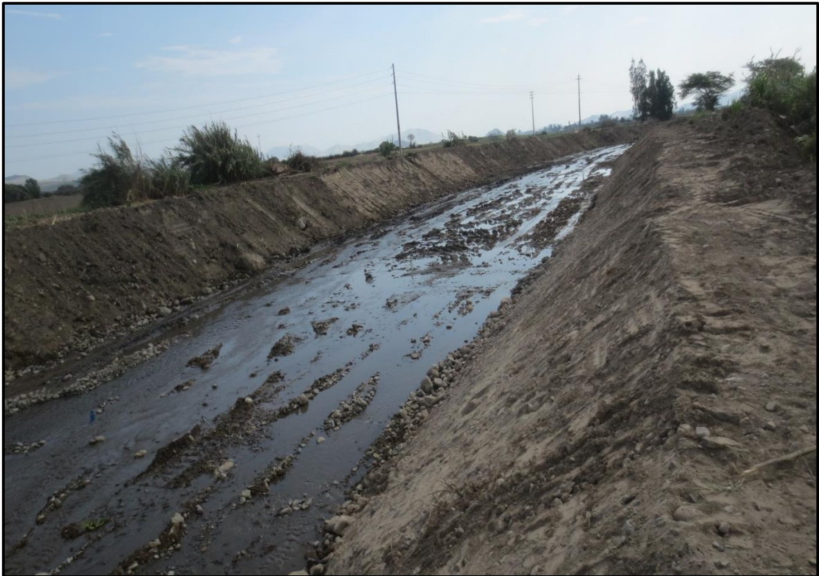
FOTO 59: se muestra una de las actividades de Prevención 2015-2016 III Paquete, Descolmatación y Encauzamiento del Río Huamanzaña, Sector Palermo., Terminado.