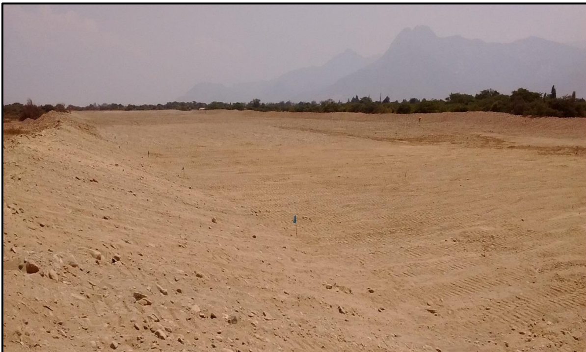
FOTO 64: se muestra una de las actividades de Prevención 2015-2016 Adicional I Paquete, Limpieza y Descolmatación del cauce del río Chaman, Sector Huaca Blanca baja, Distrito de Pacanga - Chepen- la Libertad, Terminado.