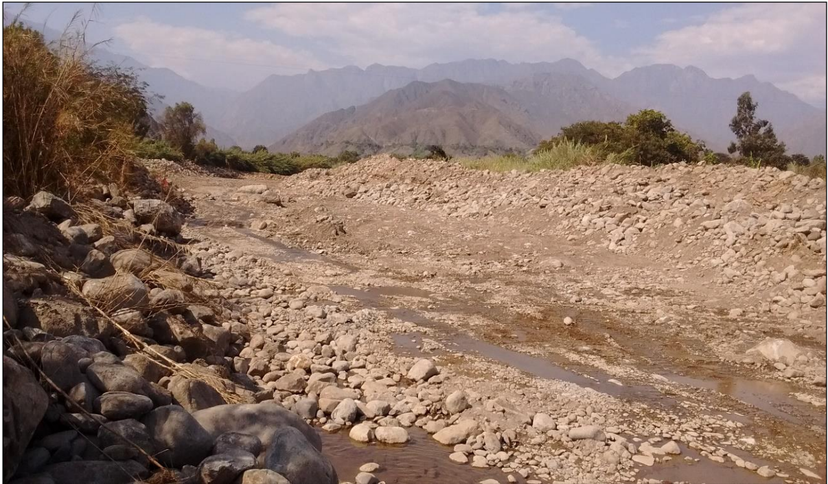
FOTO 21: se muestra una de las actividades de Prevención 2015-2016 en río Virú, tramo toma Benítes, Sector Huacapongo, terminado