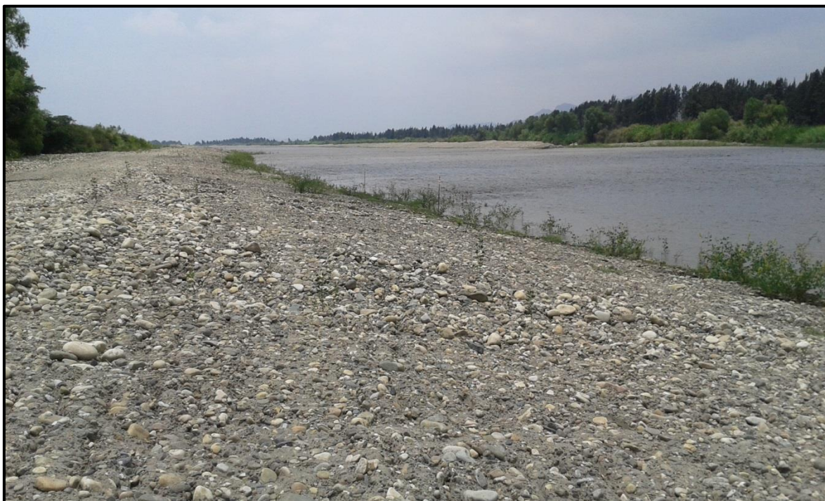
FOTO 47: Evaluación del comportamiento ante aumento del caudal en el río Chicama, sector Voladero, fechas: 02-03/02/2016, donde los trabajos de descolmatación están respondiendo ante la crecida del río, no se ha evidenciado desbordes.