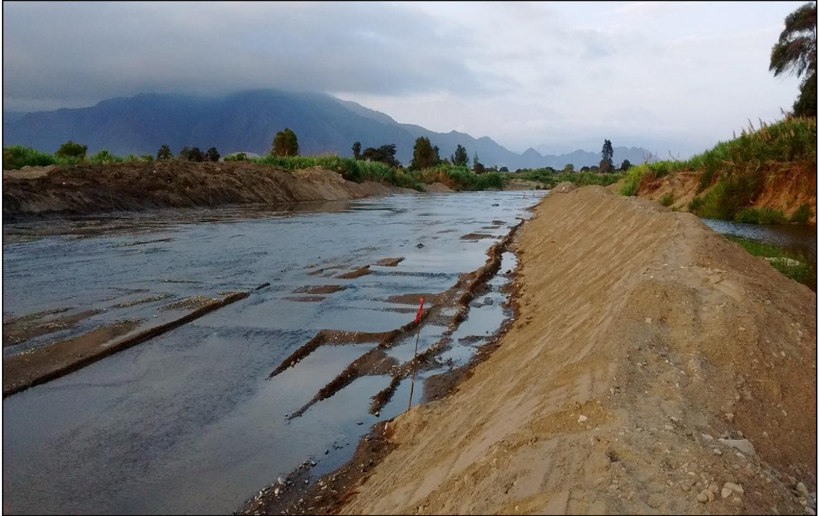
FOTO 29: se muestra una de las actividades de Prevención 2015-2016 en río Virú, tramo Serafin de la Cruz, Sector Santa Elena, Terminado.