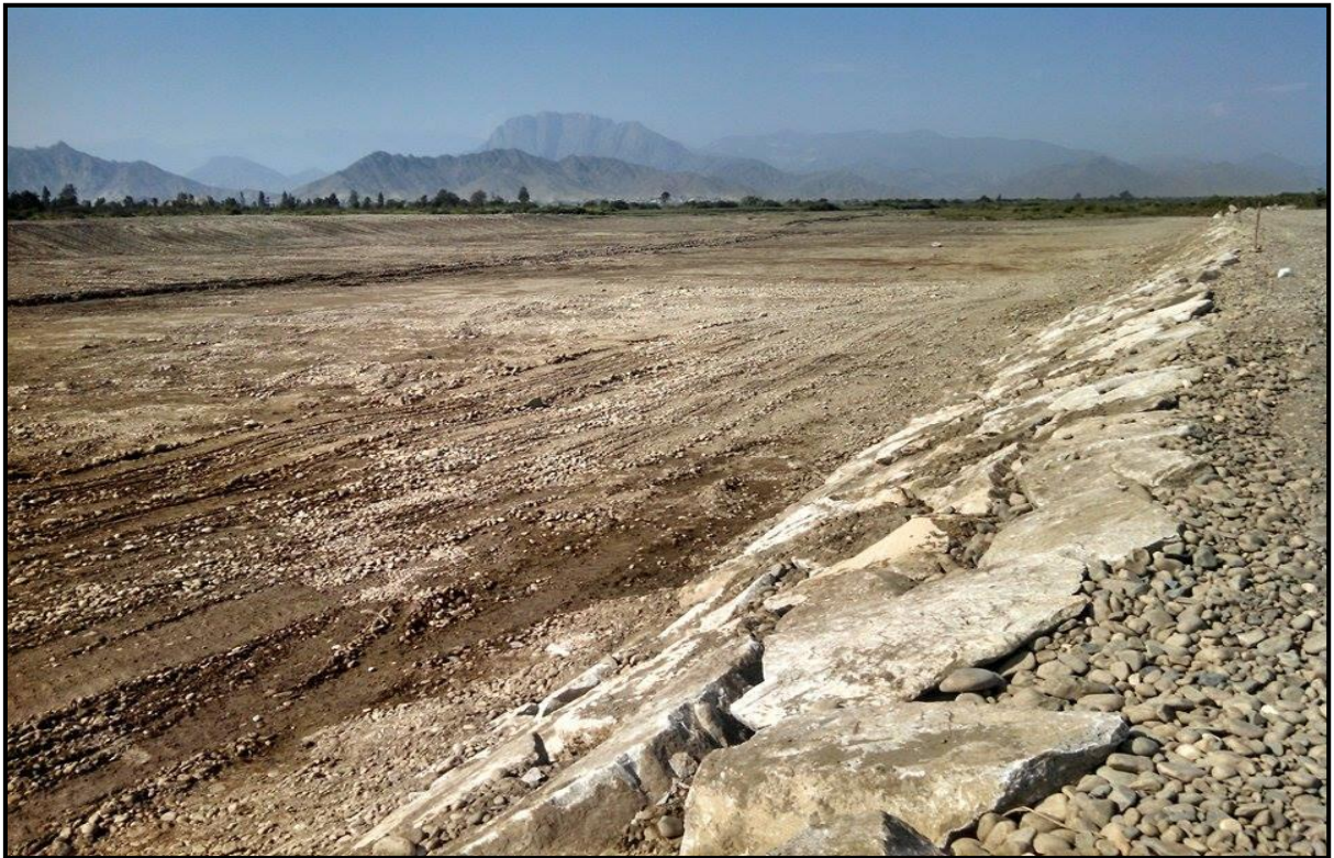
FOTO 17: se muestra una de las actividades de Prevención 2015-2016 en río Chicama, sector Cañal, terminado.