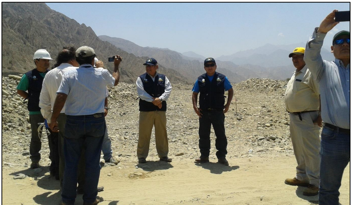
FOTO 08: se muestra una de las actividades de Prevención 2015-2016 en la Quebrada Quirripano, Parte Alta, terminado.