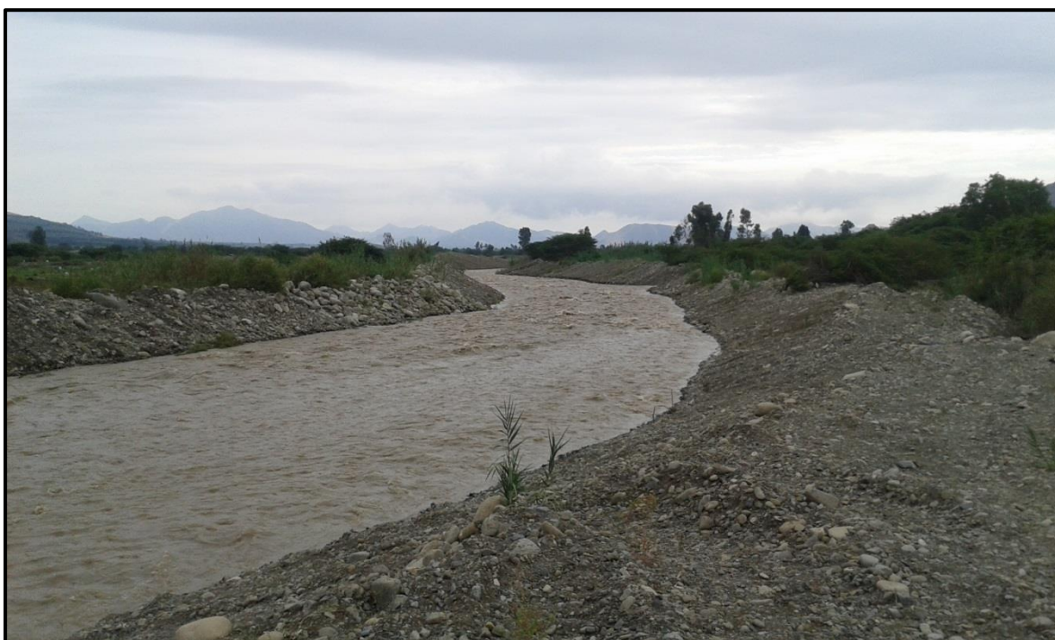
FOTO 54: Evaluación del comportamiento ante aumento del caudal en el río Virú, sector el Niño, fechas: 02-03/02/2016, donde los trabajos de descolmatación están respondiendo ante la crecida del río, no se ha evidenciado desbordes.