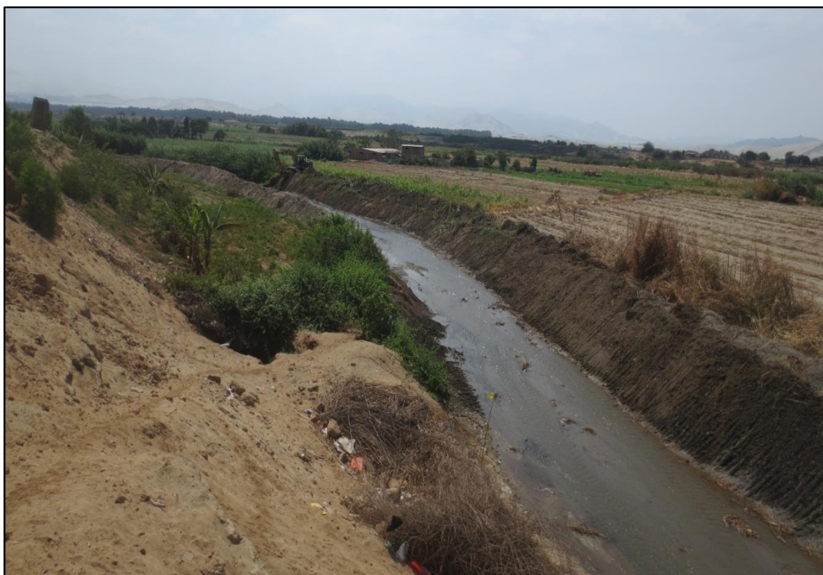
FOTO 32: se muestra una de las actividades de Prevención 2015-2016, Descolmatación y encauzamiento del río Huamanzaña, sector El Rosario, Terminado.