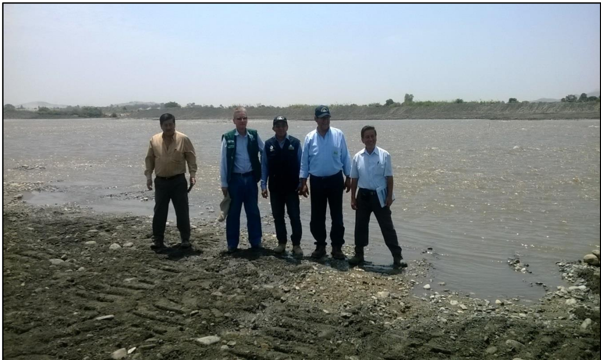
FOTO 20: se muestra una de las actividades de Prevención 2015-2016 en río Santa, sector Pueblo Nuevo en ejecución