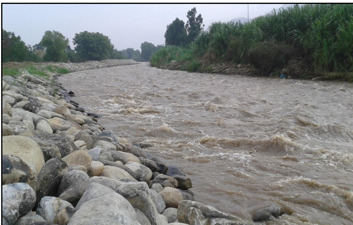
FOTO 50: Evaluación del comportamiento ante aumento del caudal en el río Moche, sector la Mochica, fechas: 02-03/02/2016, donde los trabajos de descolmatación están respondiendo ante la crecida del río, no se ha evidenciado desbordes.