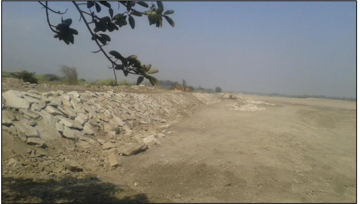
FOTO 11: se muestra una de las actividades de Prevención 2015-2016 en el río Chicama, sector Bocatoma Paijan Viejo, Terminado.