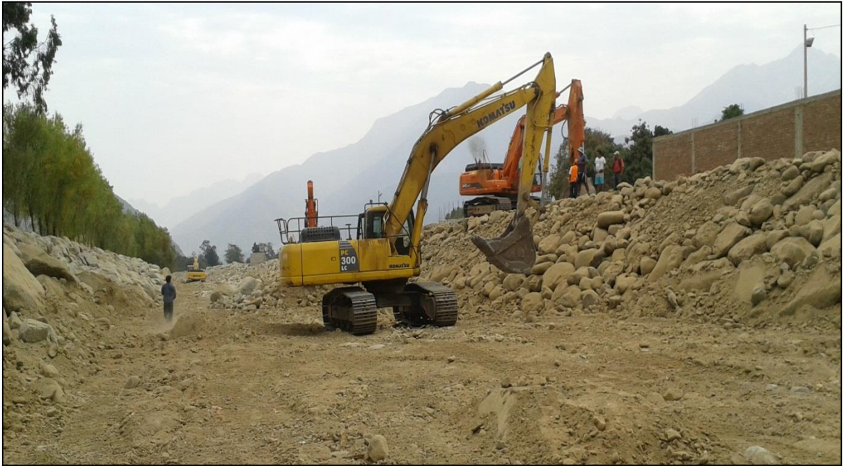
FOTO 37: se muestra una de las actividades de Prevención 2015-2016 en río Pedregal-Simbal, Terminado.