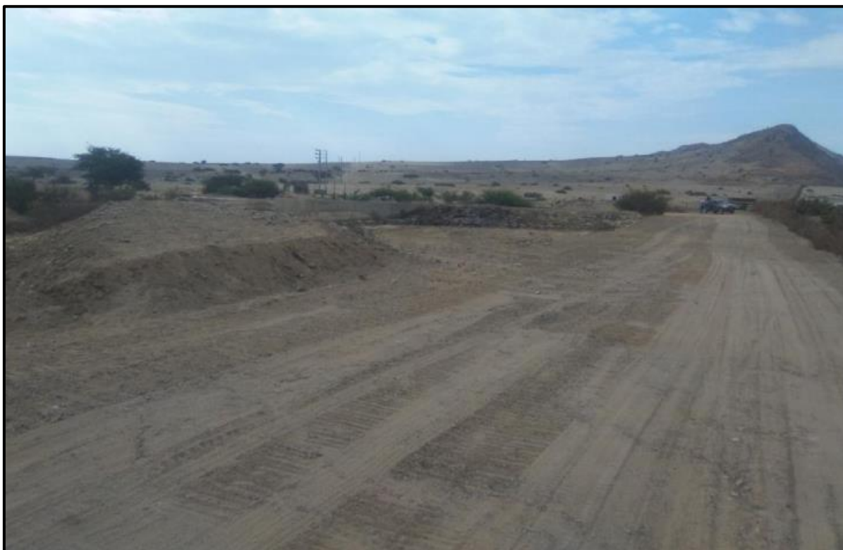
FOTO 62: se muestra una de las actividades de Prevención 2015-2016 Adicional I Paquete, Defensa Margen Derecha Canal Talambo Zaña Km: 24+552 - 31+315, Terminado.