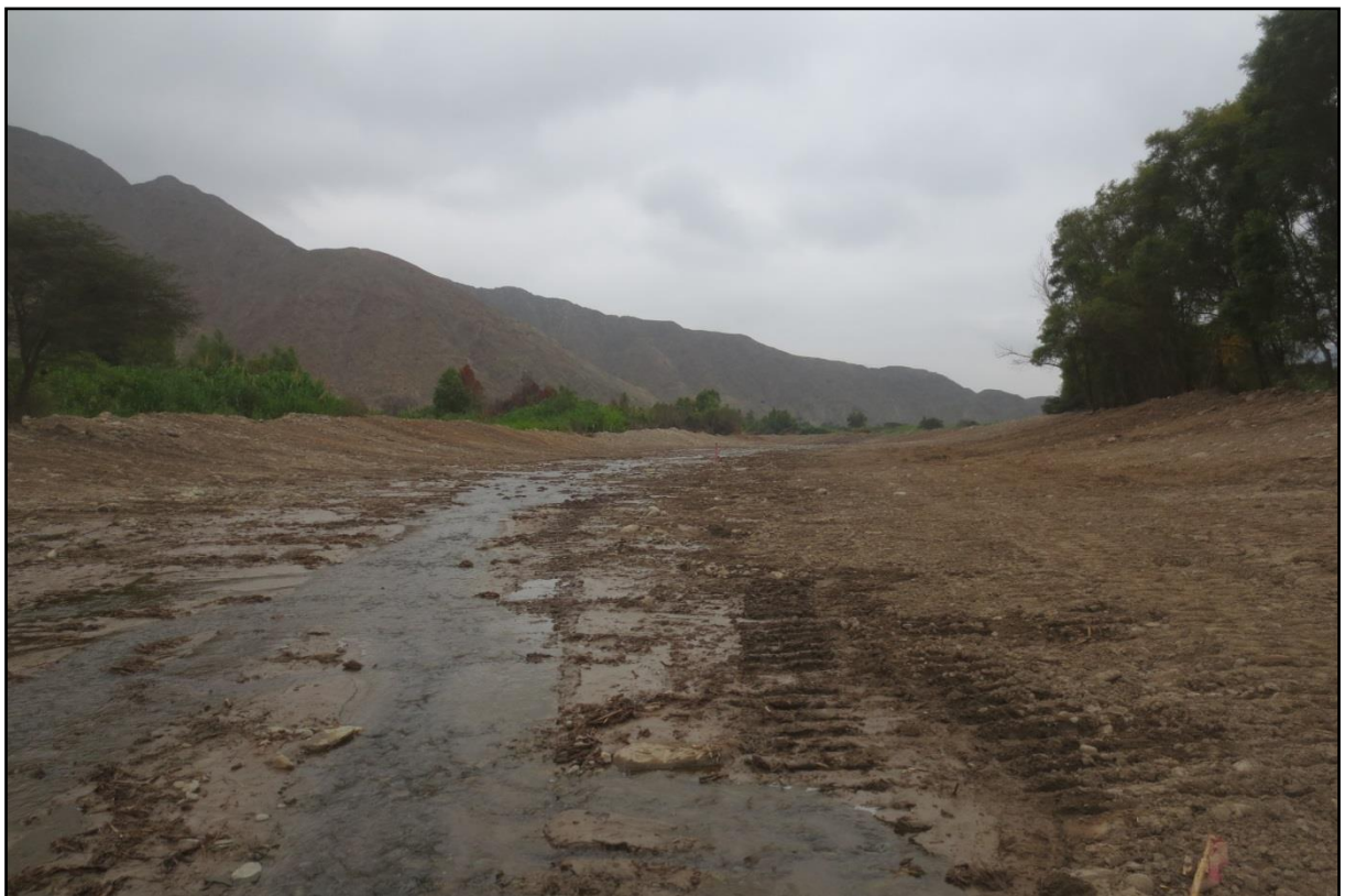
FOTO 24: se muestra una de las actividades de Prevención 2015-2016 en río Virú, tramo Enrique Toro, Sector Tomabal, Terminado.