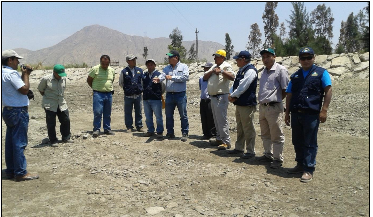
FOTO 12: se muestra una de las actividades de Prevención 2015-2016, Descolmatación y Protección de la margen izquierda del río Chicama, sector Voladero, terminado.