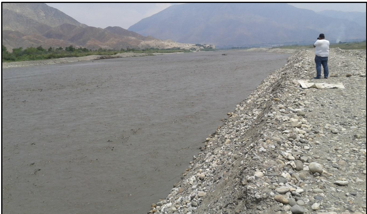
FOTO 46: Evaluación del comportamiento ante aumento del caudal en el río Chicama, sector la Botella Pampas, fechas: 02-03/02/2016, donde los trabajos de descolmatación están respondiendo ante la crecida del río, no se ha evidenciado desbordes.