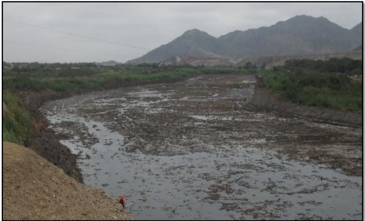
FOTO 07: se muestra una de las actividades de Prevención 2015-2016 en río Chaman, sector Tahuantinsuyo, terminado.