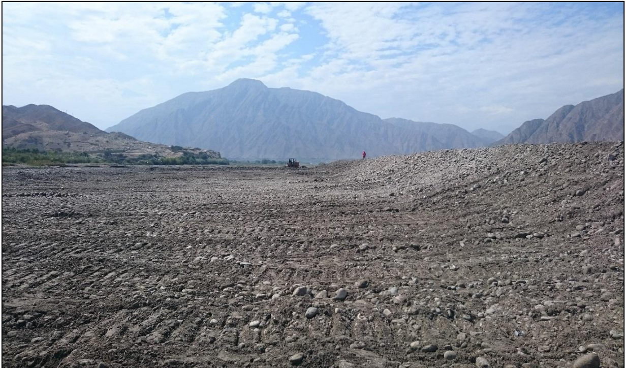
FOTO 15: se muestra una de las actividades de Prevención 2015-2016, Descolmatación del cauce del río Chicama, sector la Botella Pampas, terminado.