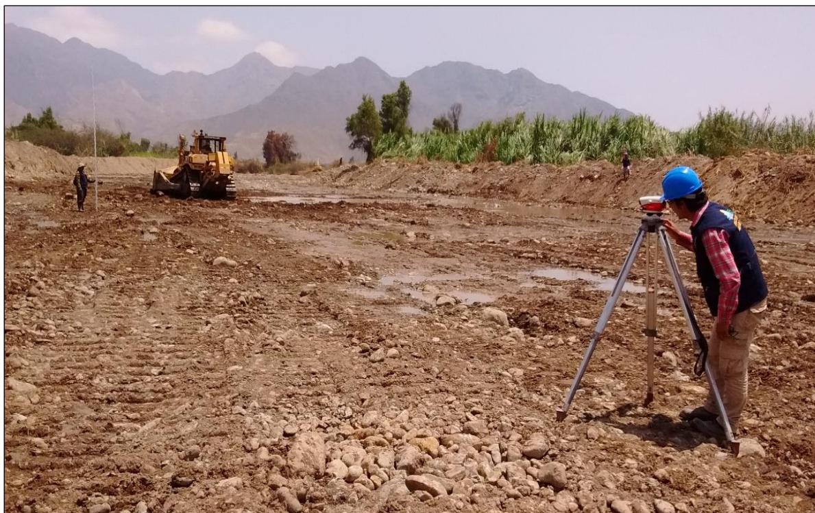
FOTO 26: se muestra una de las actividades de Prevención 2015-2016 en río Virú, tramo toma San Nicolás, Sector San Nicolás, Terminado.