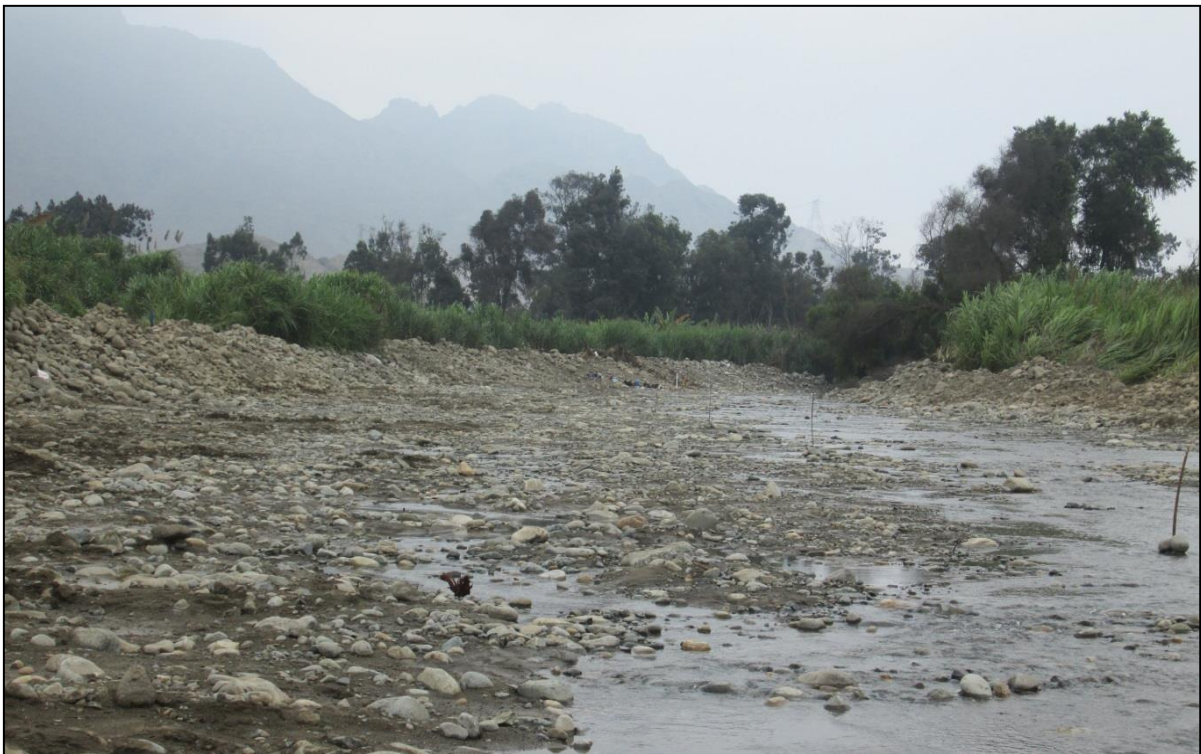
FOTO 42: se muestra una de las actividades de Prevención 2015-2016, Descolmatación de la margen Izquierda del río Moche, sector Bocatoma Huatape, Terminado.