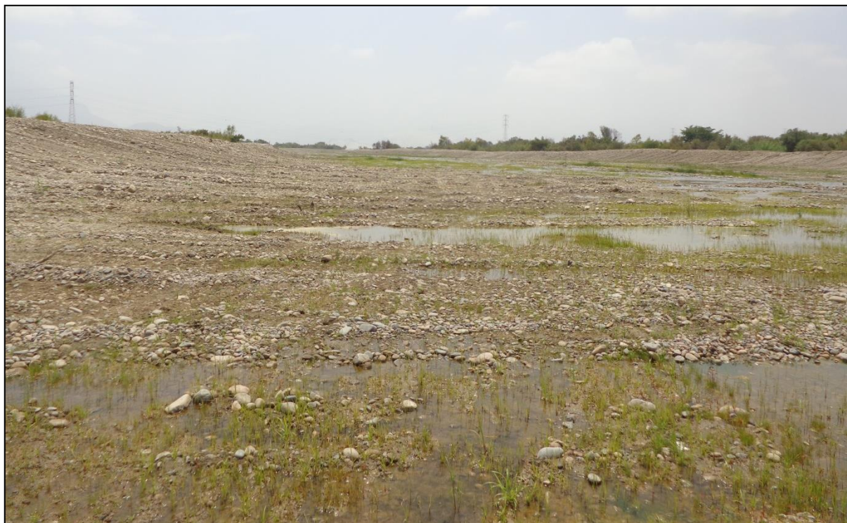
FOTO 03: se muestra una de las actividades de Prevención 2015-2016 en río Jequetepeque, sector Infiernillo de Cultambo, terminado.