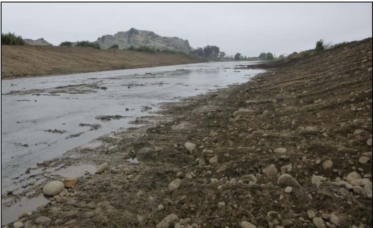
FOTO 40: se muestra una de las actividades de Prevención 2015-2016, Descolmatación protección del río Moche- Sector Curva de Sun - La Bocana - Toma La Bocana, Terminado.