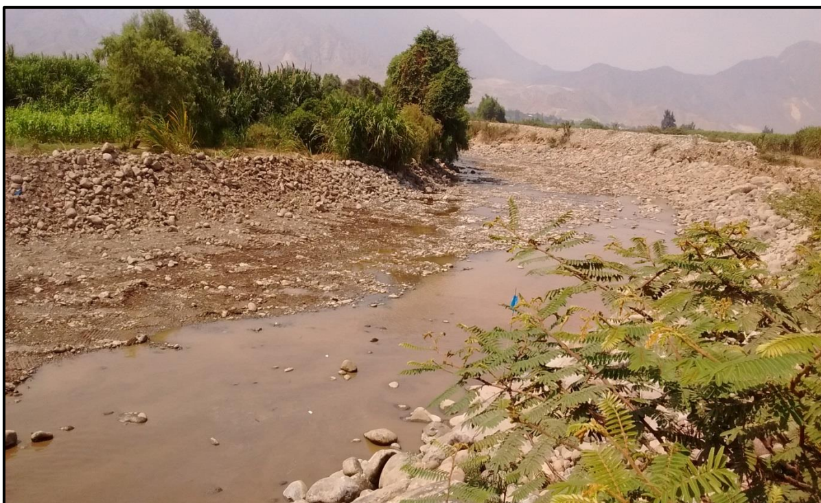
FOTO 44: se muestra una de las actividades de Prevención 2015-2016, Descolmatación de la margen derecha del río Moche, sector Bocatoma Moro-Vichanzao, Terminado.