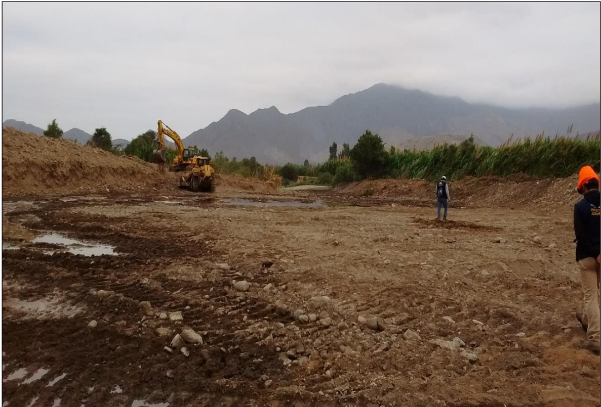
FOTO 27: se muestra una de las actividades de Prevención 2015-2016 en río Virú, tramo Pompillo Cotrina, Sector San Nicolás, Terminado.