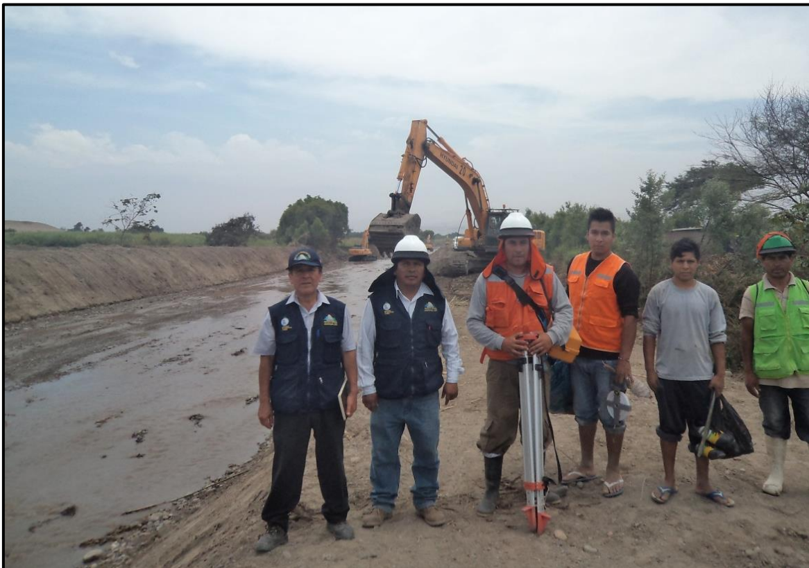
FOTO 58: se muestra una de las actividades de Prevención 2015-2016 III Paquete, Descolmatación y Encauzamiento del Río Chorobal, Sector El Inca, Terminado.