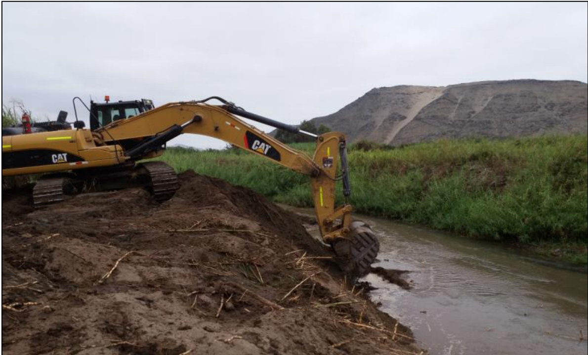
FOTO 35: se muestra una de las actividades de Prevención 2015-2016, roca al volteo en el río Chao, sector Laramie, terminado.