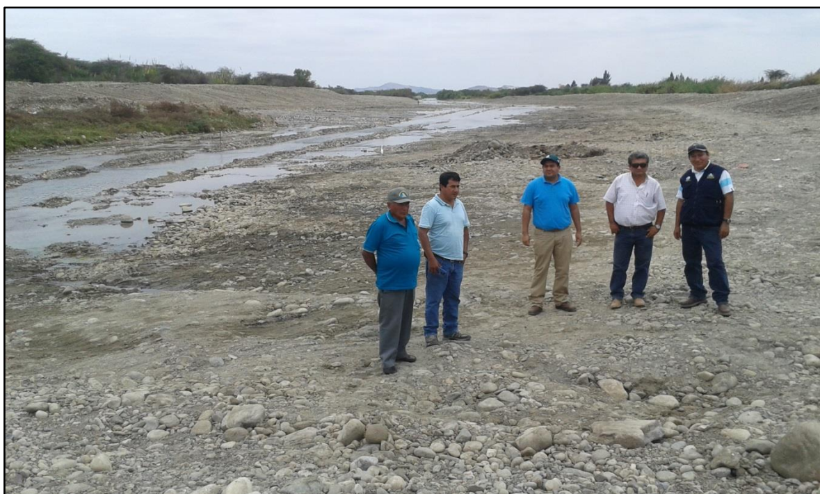
FOTO 02: se muestra una de las actividades de Prevención 2015-2016 en río Jequetepeque, sector Bocatoma San Pedro - San José, terminado.