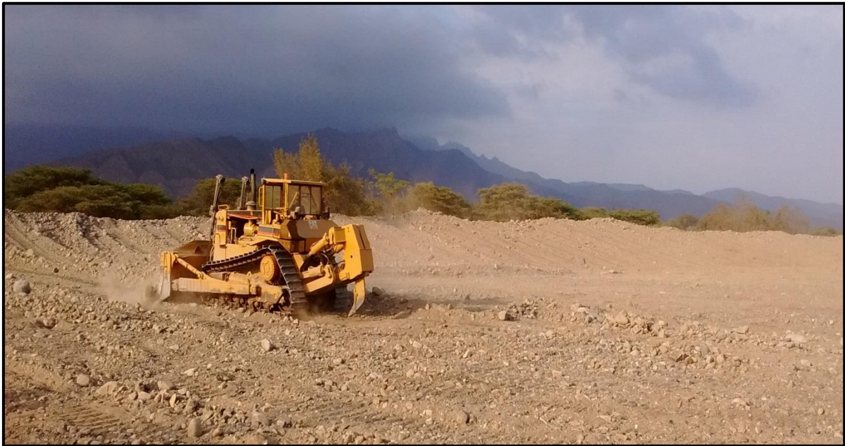
FOTO 63: se muestra una de las actividades de Prevención 2015-2016 Adicional I Paquete, Limpieza y Descolmatación del cauce del río Chaman, Sector La Cataluña, Distrito de Pacanga - Chepen- la Libertad, Terminado.