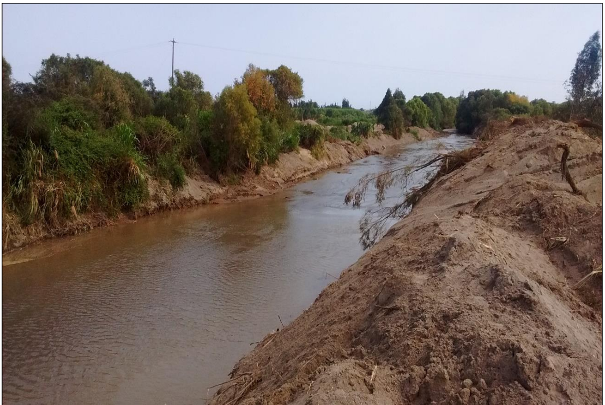
FOTO 30: se muestra una de las actividades de Prevención 2015-2016 en río Virú, tramo Huancaquito Bajo, Sector Huancaquito Bajo, Terminado.