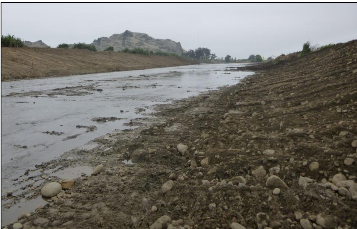
FOTO 38: se muestra una de las actividades de Prevención 2015-2016, Descolmatación protección del río Moche M.I., sector Puente Moche - Laguna de Estabilización Curva Sun - Toma Arenal Sánchez ( Santa Lucía ), Terminado