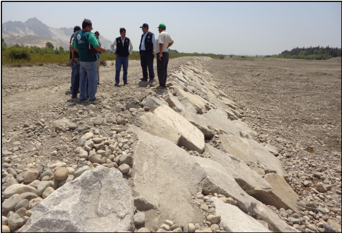
FOTO 19: se muestra una de las actividades de Prevención 2015-2016 en río Chicama, sector Alayo, Terminado.