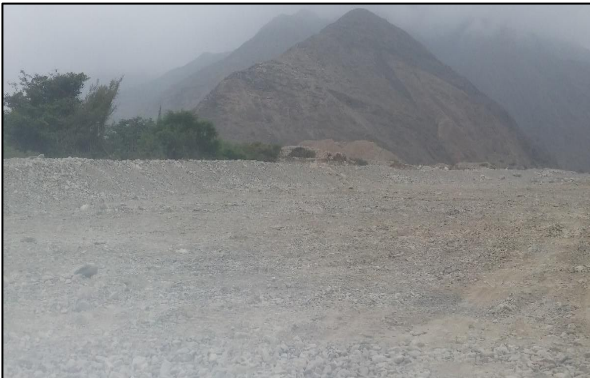
FOTO 60: se muestra una de las actividades de Prevención 2015-2016 Adicional I Paquete, Descolmatación y Protección de la margen derecha de la quebrada Caracol, Terminado.