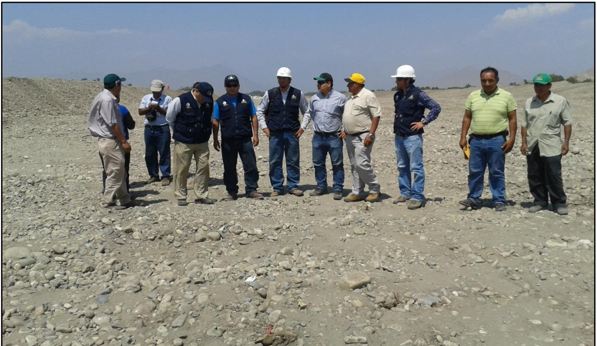
FOTO 16: se muestra una de las actividades de Prevención 2015-2016, Descolmatación del cauce del río Chicama, sector Alayo (Toma Roma), Terminado.