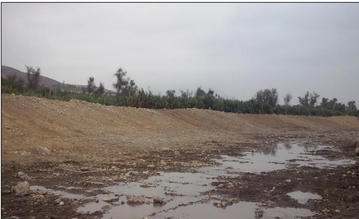
FOTO 43: se muestra una de las actividades de Prevención 2015-2016, Descolmatación de la margen derecha del río Moche, sector Bocatoma La Mochica, Terminado.