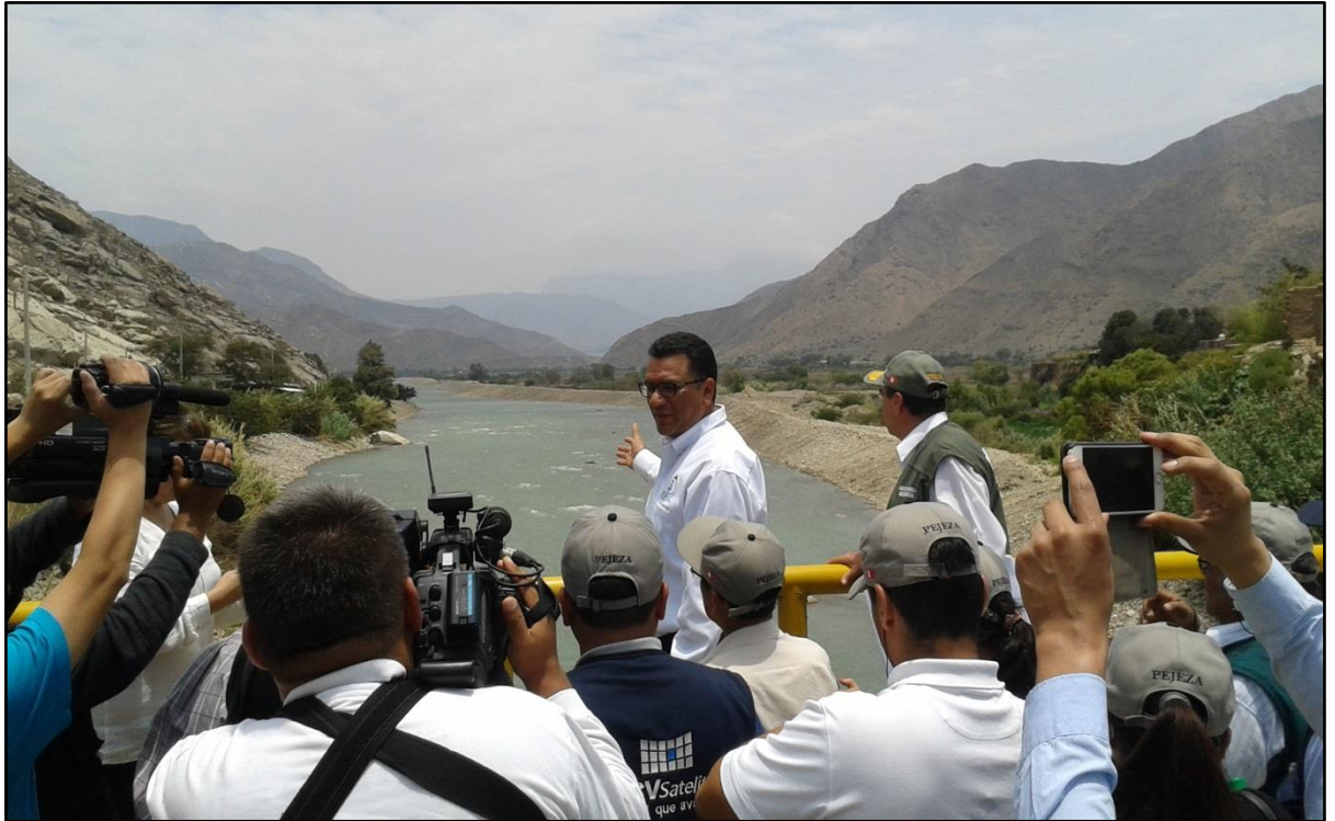
FOTO 05: se muestra una de las actividades de Prevención 2015-2016 en río Jequetepeque, sector Ventanillas, terminado.