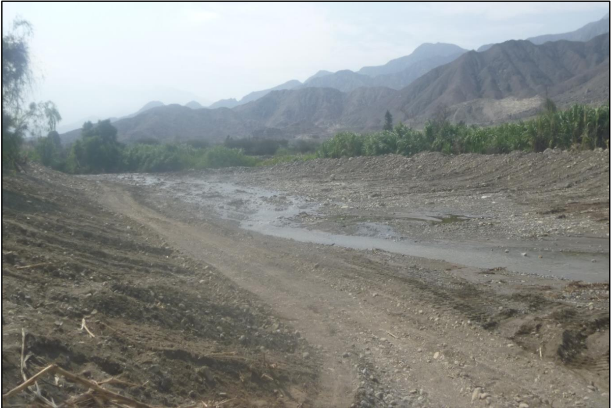
FOTO 41: se muestra una de las actividades de Prevención 2015-2016, Descolmatación y protección de la margen izquierda del río Moche, sector Bocatoma Santo Domingo, Terminado.