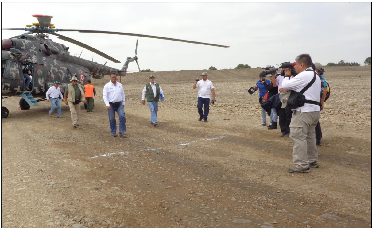
FOTO 14: se muestra una de las actividades de Prevención 2015-2016 en río Chicama, sector Toma Vallejo, Terminado.