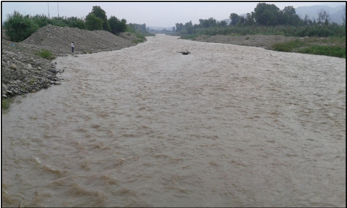
FOTO 51: Evaluación del comportamiento ante aumento del caudal en el rio Moche, sector toma santo Domingo, fechas: 02-03/02/2016, donde los trabajos de descolmatación están respondiendo ante la crecida del rio, no se ha evidenciado desbordes.