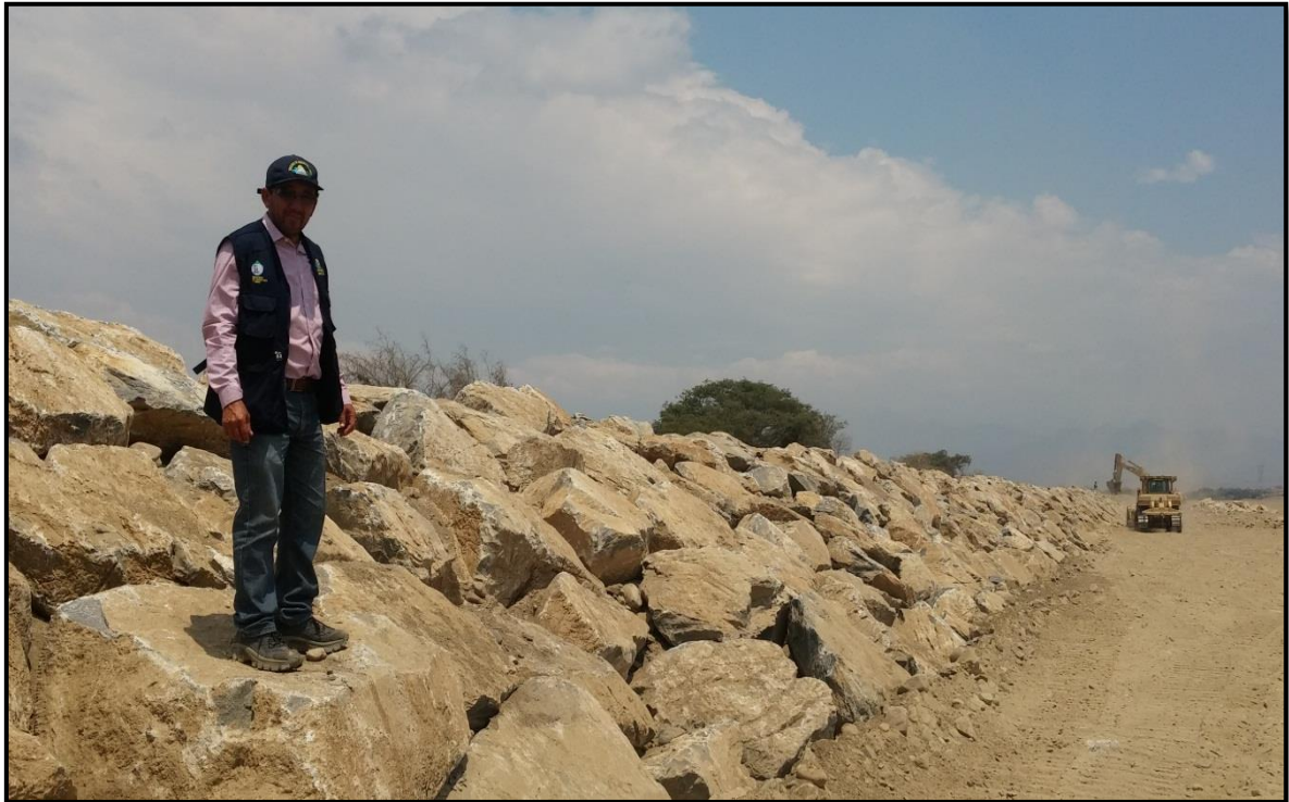
FOTO 65: se muestra una de las actividades de Prevención 2015-2016 Adicional I Paquete, Limpieza, Descolmatación y Protección del cauce del río Chaman, Sector Huaca Blanca Alta, Distrito de Pacanga-Chepen-La Libertad, Terminado.