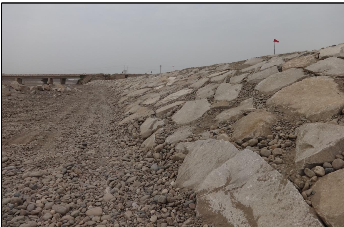
FOTO 56: se muestra una de las actividades de Prevención 2015-2016 III Paquete, Descolmatación del Río Chicama Aguas Arriba del Puente Careaga, terminado.