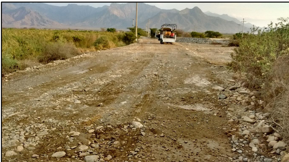
FOTO 61: se muestra una de las actividades de Prevención 2015-2016 Adicional I Paquete, Defensa Margen Derecha Canal Talambo Zaña Km: 6+834 - 24+552, Terminado.