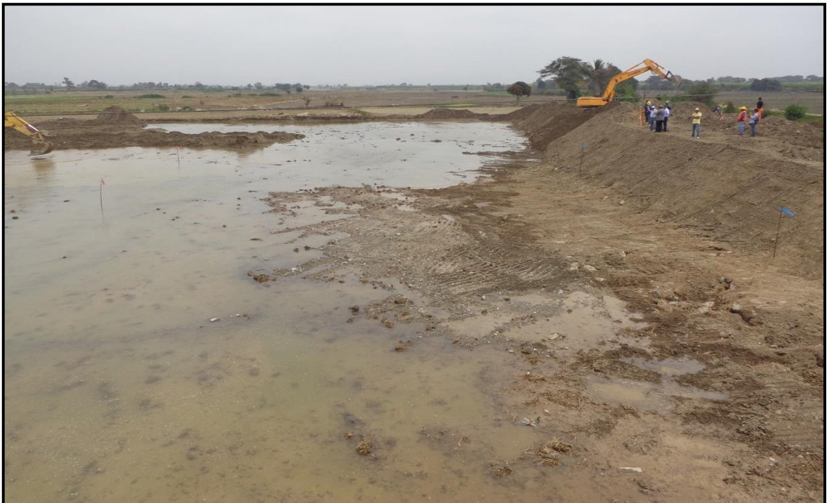
FOTO 06: se muestra una de las actividades de Prevención 2015-2016 en río Chaman, sector Puente Panamericana, terminado.