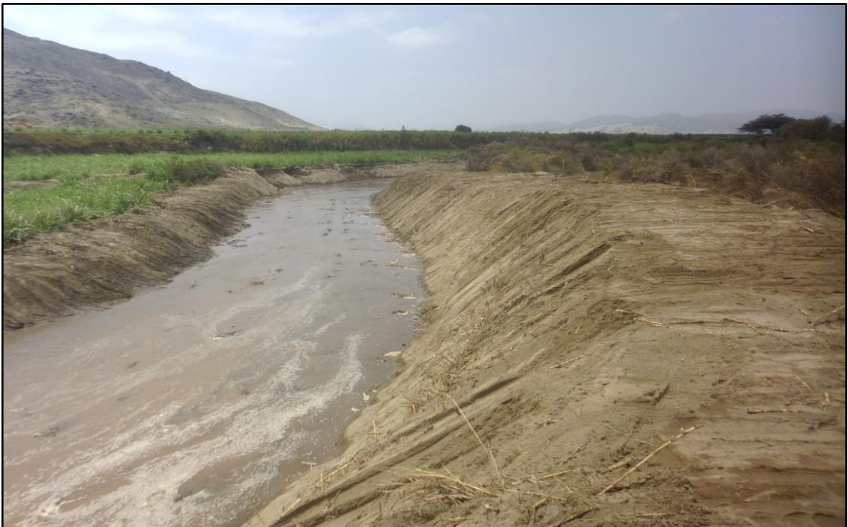
FOTO 34: se muestra una de las actividades de Prevención 2015-2016, Descolmatación y Encausamiento del rio Chorobal, sector el Tizal, Terminado.