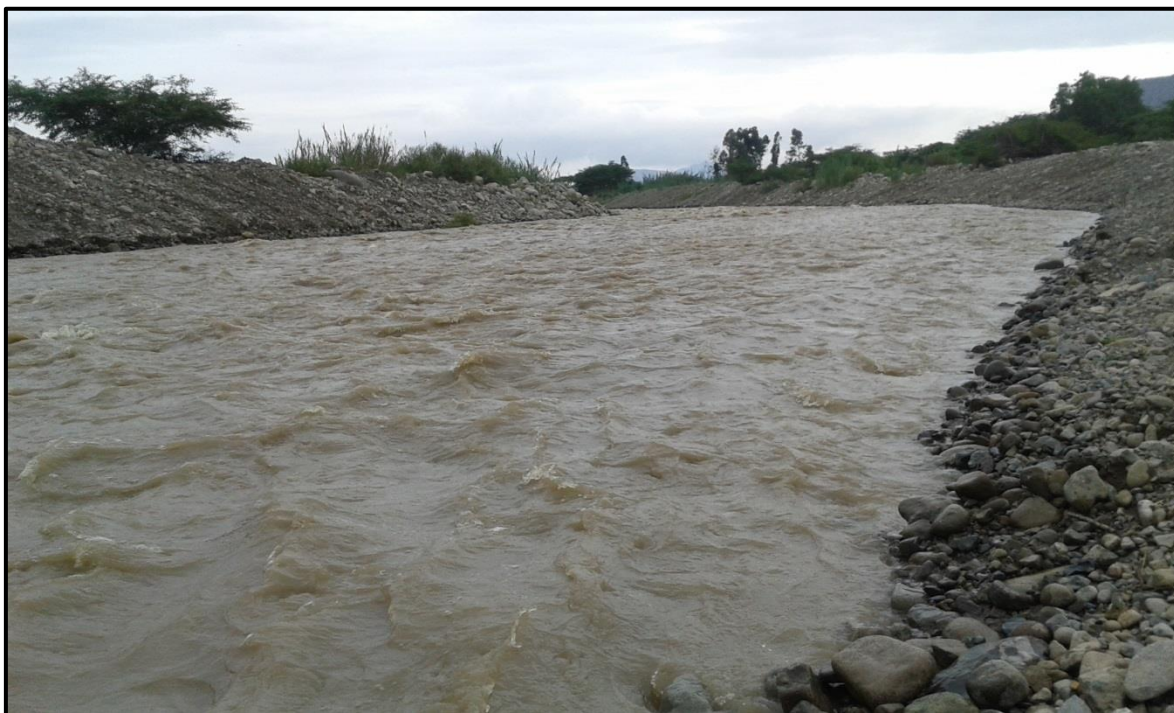
FOTO 53: Evaluación del comportamiento ante aumento del caudal en el río Virú, sector Tomabal, fechas: 02-03/02/2016, donde los trabajos de descolmatación están respondiendo ante la crecida del río, no se ha evidenciado desbordes.