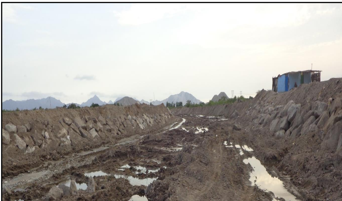
FOTO 31: se muestra una de las actividades de Prevención 2015-2016, Protección con roca ambas márgenes río Huamanzaña, sector San Carlos, Terminado.