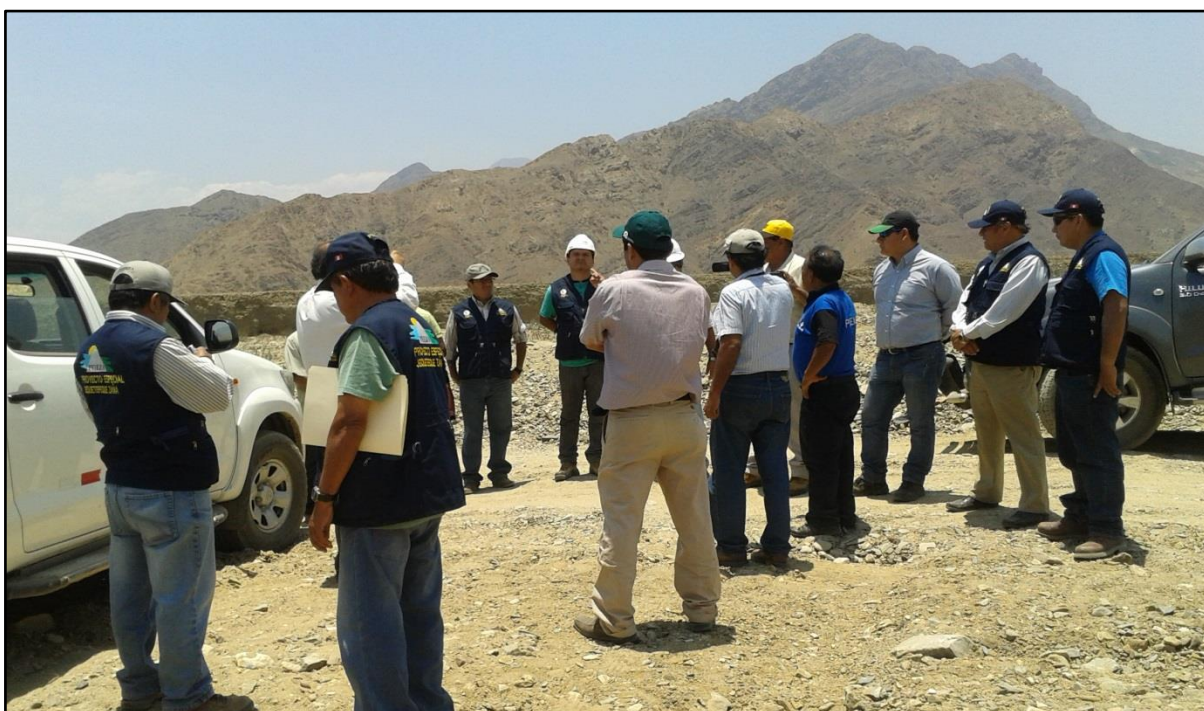
FOTO 10: se muestra una de las actividades de Prevención 2015-2016 en la Quebrada Mal Alma, Parte Alta, Terminado.