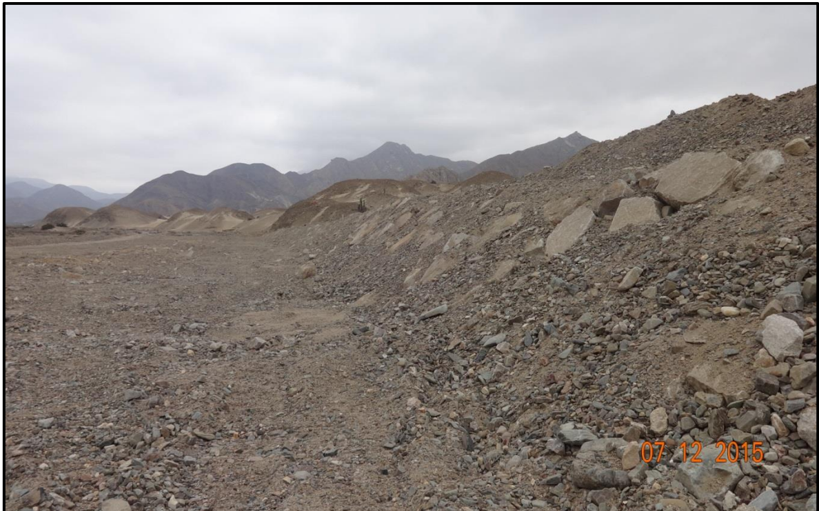
FOTO 66: se muestra una de las actividades de Prevención 2015-2016 Adicional I Paquete, Protección con roca al volteo de la quebrada mal Alma, sector Sausal, Terminado.