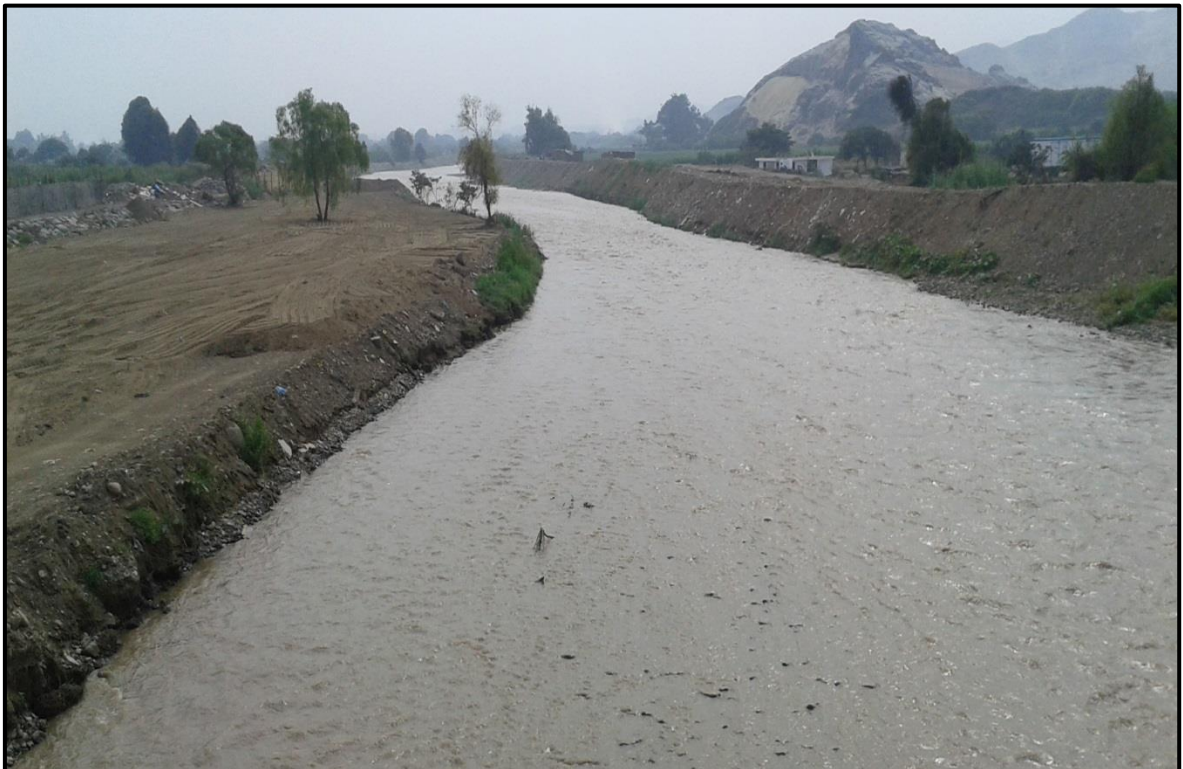
FOTO 52: Evaluación del comportamiento ante aumento del caudal en el rio Moche, sector - Santa Lucia, fechas: 02-03/02/2016, donde los trabajos de descolmatación están respondiendo ante la crecida del rio, no se ha evidenciado desbordes.