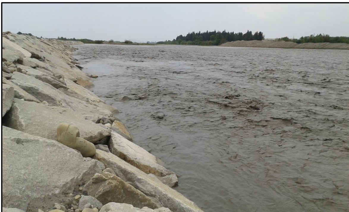
FOTO 48: Evaluación del comportamiento ante aumento del caudal en el río Chicama, sector Atahualpa, fechas: 02-03/02/2016, donde el dique con protección de roca acomodada en el talud húmedo, están respondiendo ante la crecida del río, no se ha evidenciado desbordes.