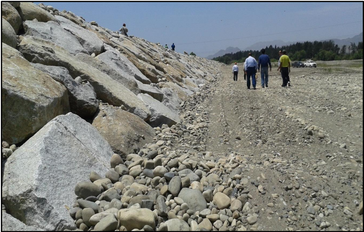
FOTO 67: se muestra una de las actividades de Prevención 2015-2016 Adicional I Paquete, Protección con roca al volteo en el río Chicama, Sector Voladero - Atahualpa, Terminado.