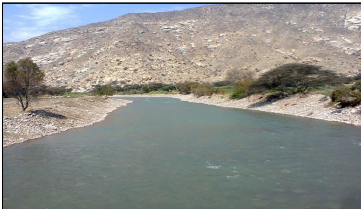
FOTO 04: se muestra una de las actividades de Prevención 2015-2016 en río Jequetepeque, sector Pay Pay, terminado