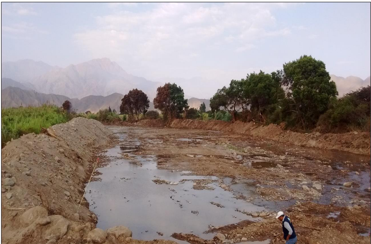
FOTO 28: se muestra una de las actividades de Prevención 2015-2016 en río Virú, tramo San Idefonso, Sector la Gloria, Terminado.