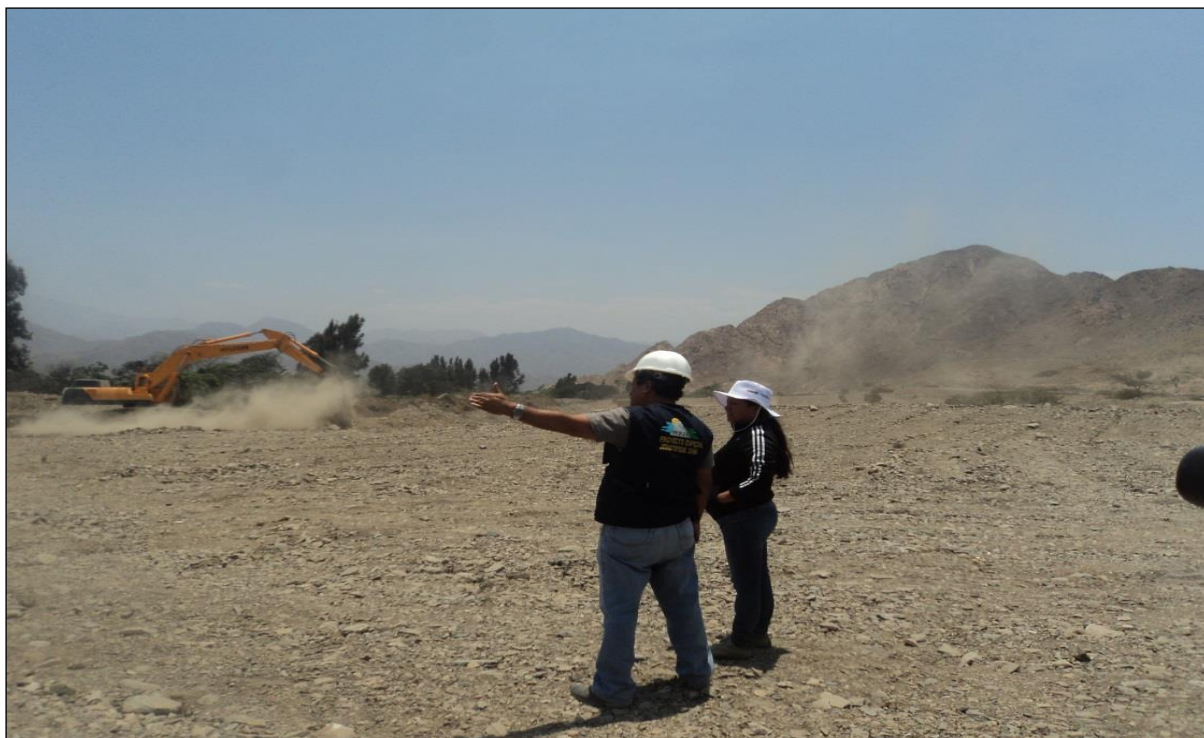
FOTO 09: se muestra una de las actividades de Prevención 2015-2016 en la Quebrada Palenque, Parte Alta, terminado.