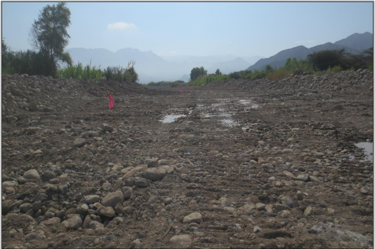
FOTO 23: se muestra una de las actividades de Prevención 2015-2016 en río Virú, Sector Vinzos, Terminado