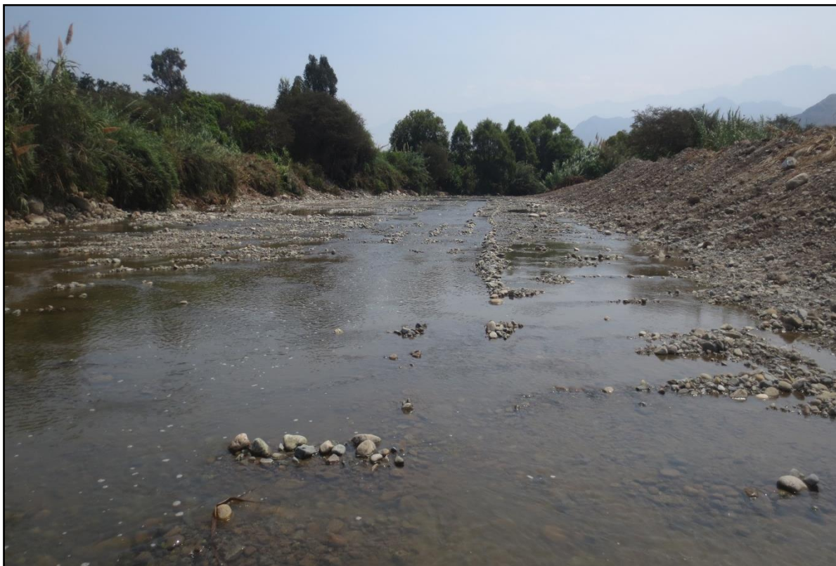
FOTO 25: se muestra una de las actividades de Prevención 2015-2016 en río Virú, tramo Gaspar Abanto, Sector Zaraque, Terminado.