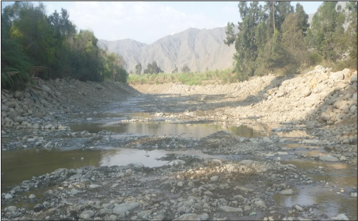
FOTO 45: se muestra una de las actividades de Prevención 2015-2016, Descolmatación de la margen derecha del río Moche, sector Santa Rosa Baja, Terminado.