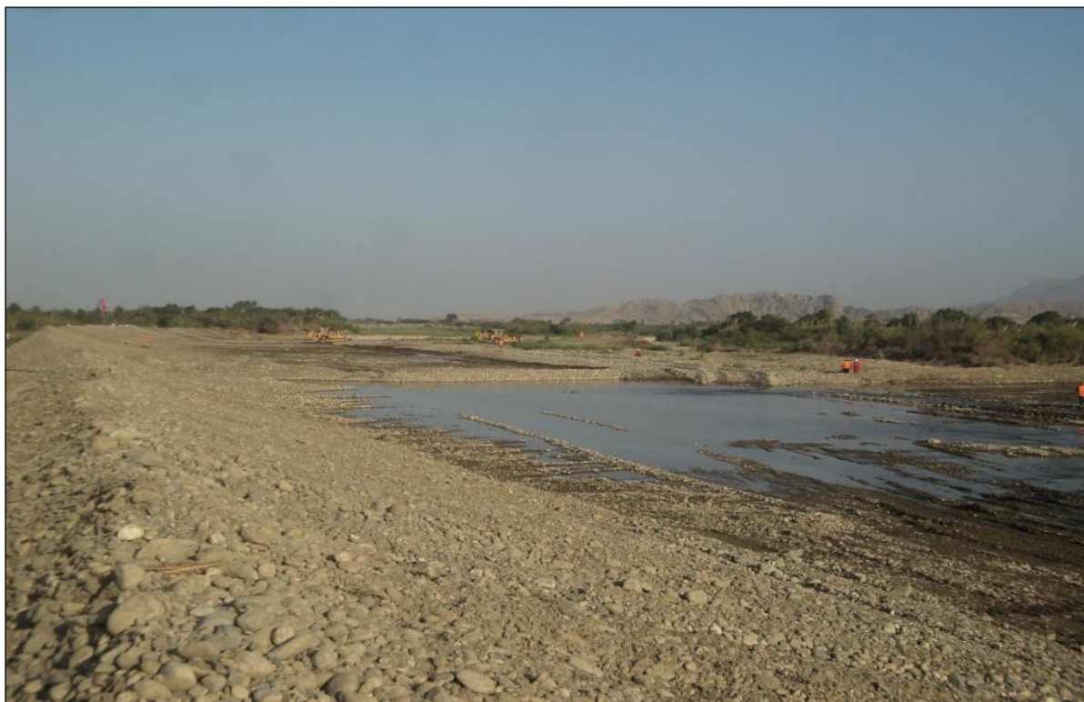
FOTO 01: se muestra una de las actividades de Prevención 2015-2016 en río Jequetepeque, sector Cosque terminado.