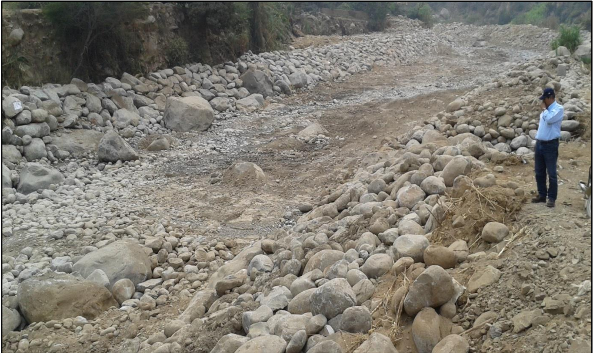
FOTO 39: se muestra una de las actividades de Prevención 2015-2016, Descolmatación protección del río Moche, sector La Tranca - Puente Poroto, Terminado