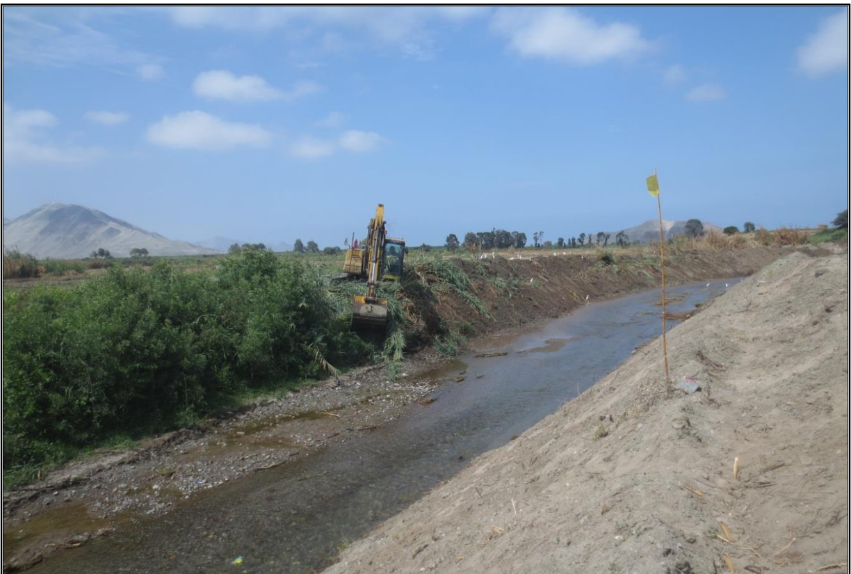
FOTO 36: se muestra una de las actividades de Prevención 2015-2016, Descolmatación y Encausamiento del río Chao, sector las delicias, Terminado.