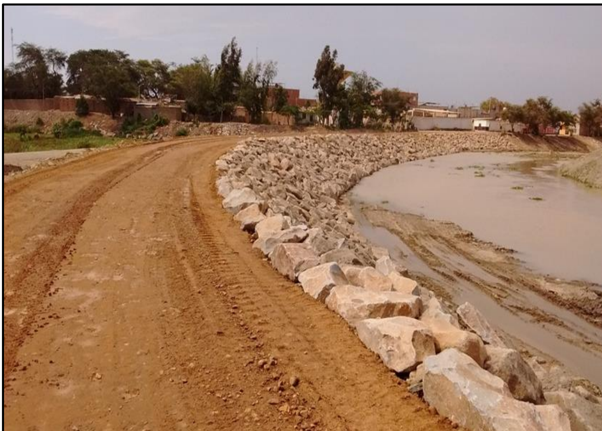
FOTO 55: se muestra una de las actividades de Prevención 2015-2016 III Paquete, Protección con Roca al Volteo, Margen Izquierda del Río Chaman, Sector Pueblo Nuevo, Terminado.