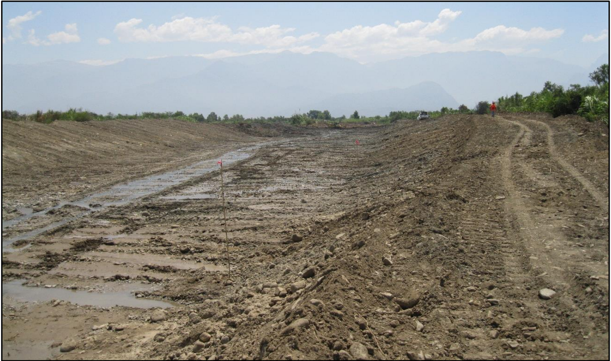
FOTO 33: se muestra una de las actividades de Prevención 2015-2016, Descolmatación y Encausamiento del rio Chorobal, sector San Roberto, Terminado.