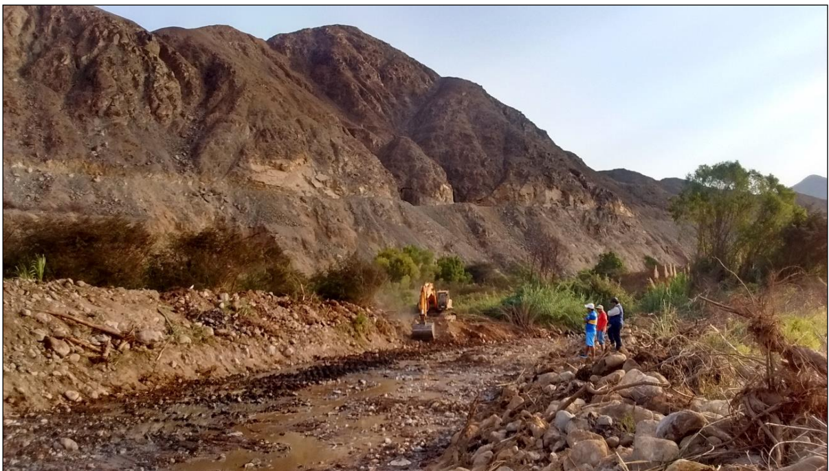
FOTO 22: se muestra una de las actividades de Prevención 2015-2016 en río Virú, tramo toma Choloque, Sector el Niño, durante su ejecución (Terminado)