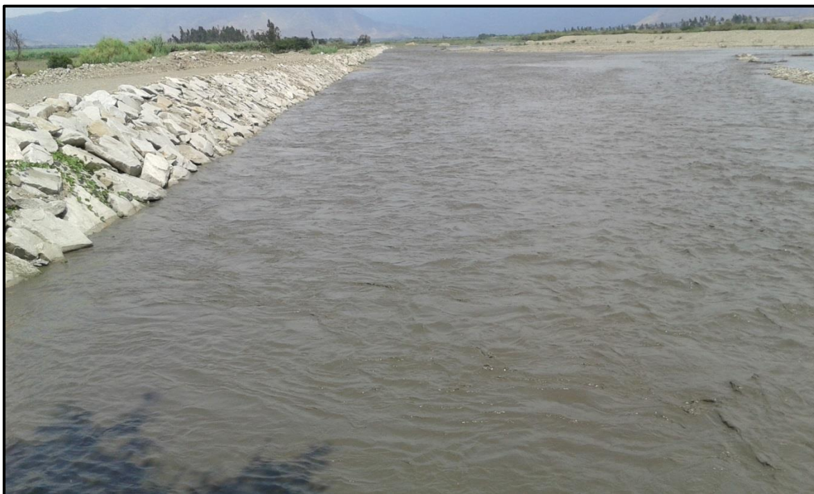
FOTO 49: Evaluación del comportamiento ante aumento del caudal en el río Chicama, sector toma Paijan Viejo, fechas: 02-03/02/2016, donde el dique con protección de roca acomodada en el talud húmedo, están respondiendo ante la crecida del río, no se ha evidenciado desbordes.