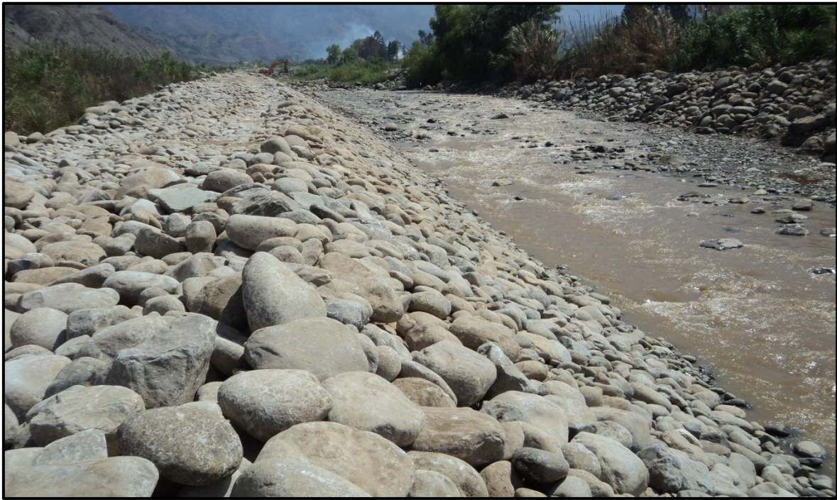
FOTO 57: se muestra una de las actividades de Prevención 2015-2016 III Paquete, Descolmatación del Río Moche, Sector Mochal, Terminado.