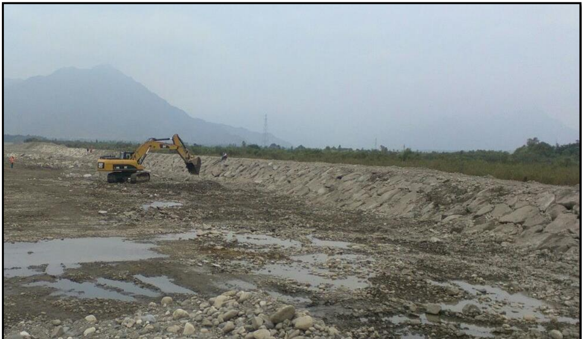
FOTO 18: se muestra una de las actividades de Prevención 2015-2016 en río Chicama, sector Atahualpa, en Terminado